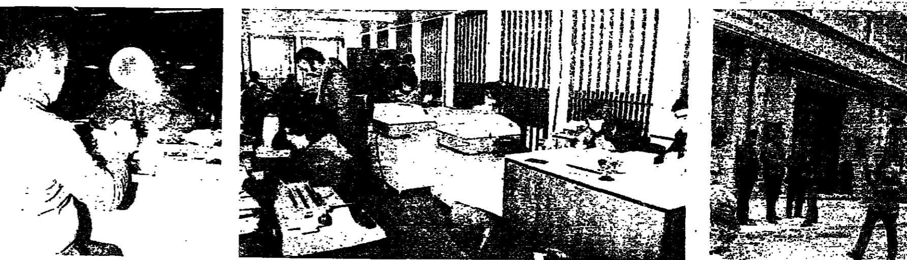
الموظفون كلهم تقريباً حضروا

الحركة في شارع المصارف امس كانت، ولاول مرة منذ 19 شهراً شبه طبيعية . القطاع المصرفي عاد رسمياً الى العمل . واليوم الاول لم يسجل مسجوليات غير عادية، مما يؤكد الثقة التي يتمتع بها الجهاز المصرفي اللبناني . ولم يكن اقبال الزبائن كثيراً، لأن عدداً غير قليل من المصارف استأنف اعماله منذ ايام، وعدداً اخر منذ أكثر من شهر .